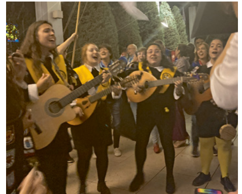
Die Tuna de Medicina am letzten Abend der Konferenz. Eine Tuna ist eine musikalische Truppe, deren Tradition bis ins 13. Jh. zurückgeht, als die Studenten mit Straßenmusik einige Münzen zum Essen verdienen mussten.